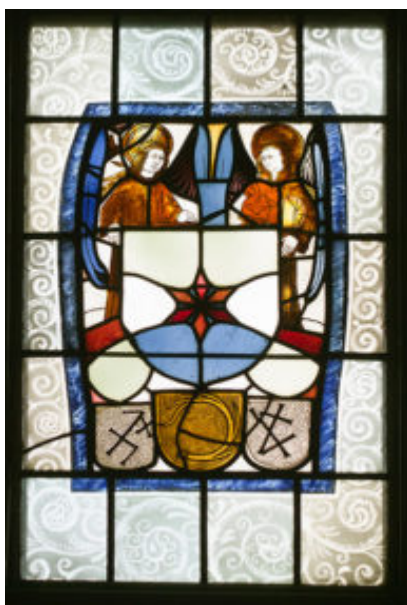
Glasfönster, Vika kyrka