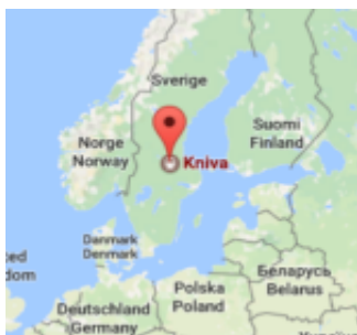
Kniva, Vika församling