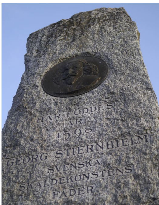
Stiernhielmsstenen i Kniva, Vika