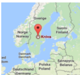
Kniva, Vika församling