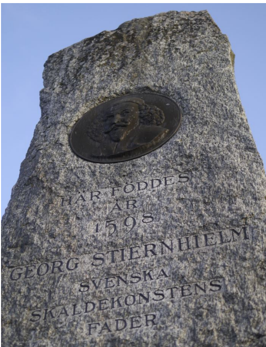
Stiernhielmsstenen i Kniva, Vika