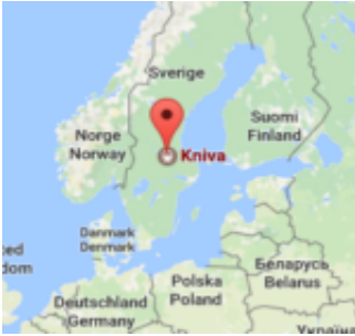
Kniva, Vika församling