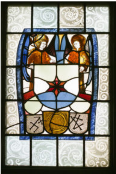
Glasfönster, Vika kyrka