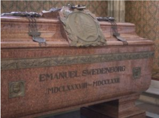
Emanuel Swedenborgs sarkofag i Uppsala Domkyrka

Resultaten finns i FTDNA-projekt Kopparberget och i Yfull-gruppen Kopparberget