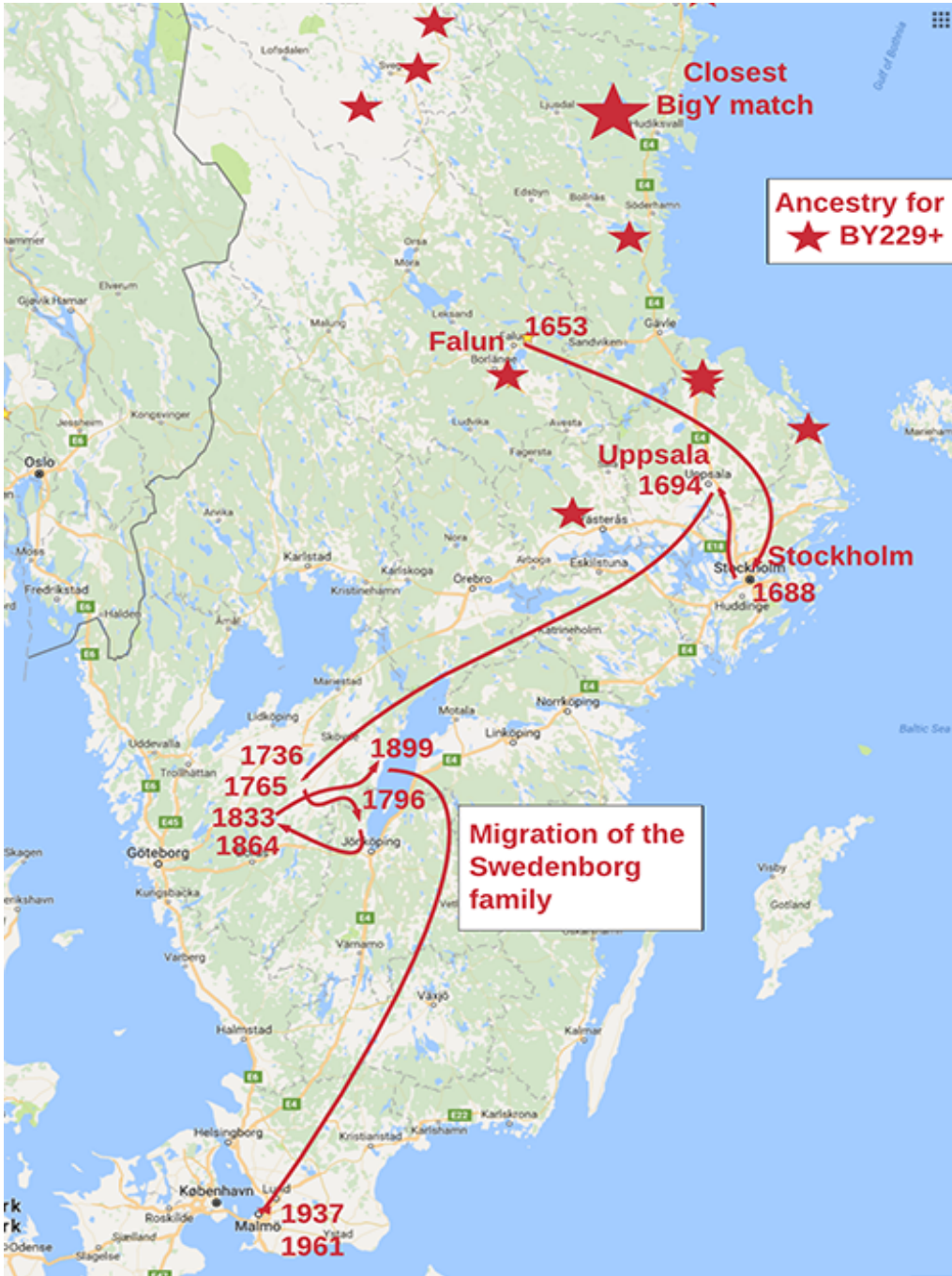
Swedenborg – origin and migration

Emanuel Swedenborg dog i London men vilar sedan 1910 i en sarkofag i Uppsala Domkyrka. Hans kranium ropades 1978 in på Sotheby's för £ 1500 för att återförenas med kroppen.